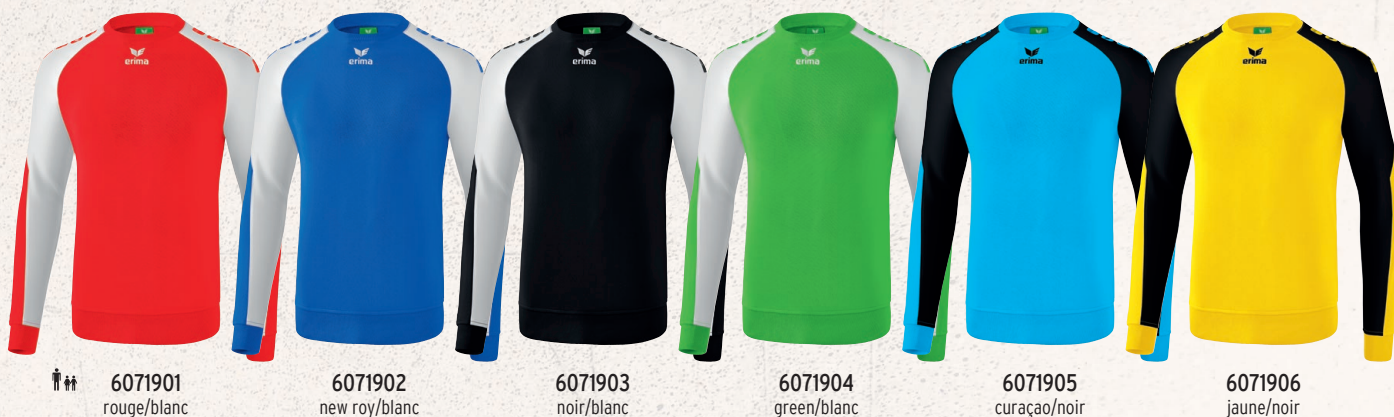
♂♂ 6071901 rouge/blanc