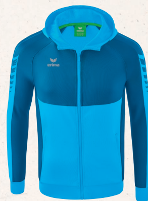
VESTE D'ENTRAÎNEMENT À CAPUCHE