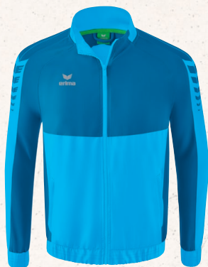
VESTE DE PRÉSENTATION