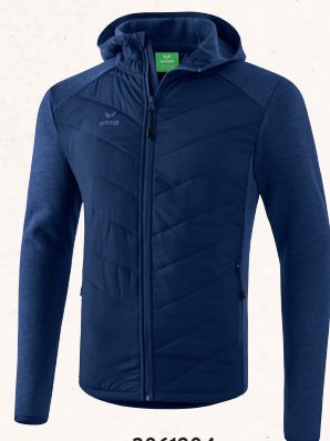
2061904 2061908 new navy