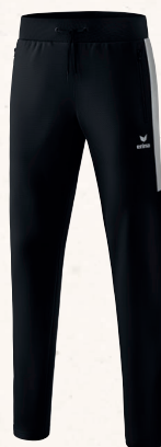
PANTALON WORKER 👤 CHF 55,-*