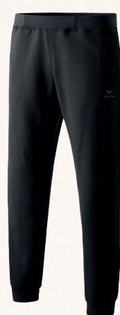
♂♂ 210330 noir