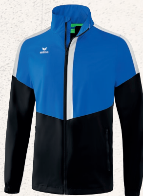
1052002 new roy/ noir/blanc