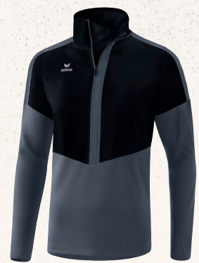
HAUT WORKER 👤 CHF 75,-*