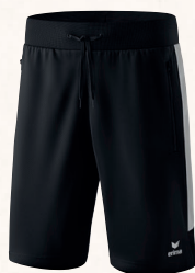
SHORT WORKER 👤 CHF 40,-*