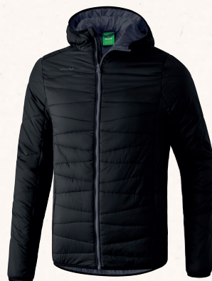
9060704 9060708 noir/gris foncé