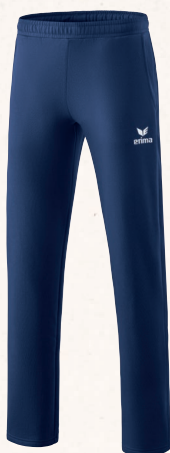
♂♂ 2101908 new navy/blanc