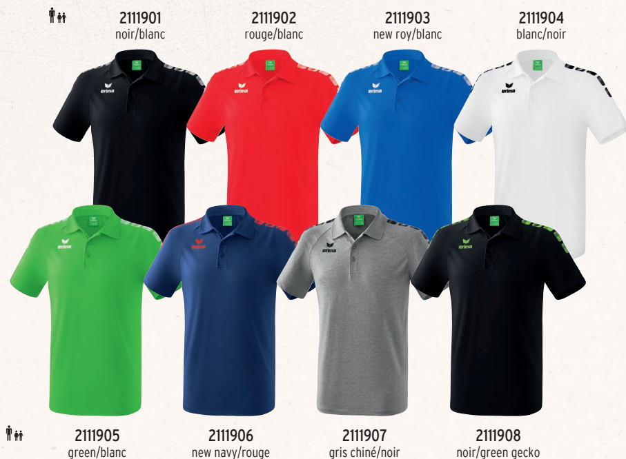
2111901 noir/blanc 2111902 rouge/blanc 2111903 new roy/blanc 2111904 blanc/noir 2111905 green/blanc 2111906 new navy/rouge 2111907 gris chiné/noir 2111908 noir/green gecko