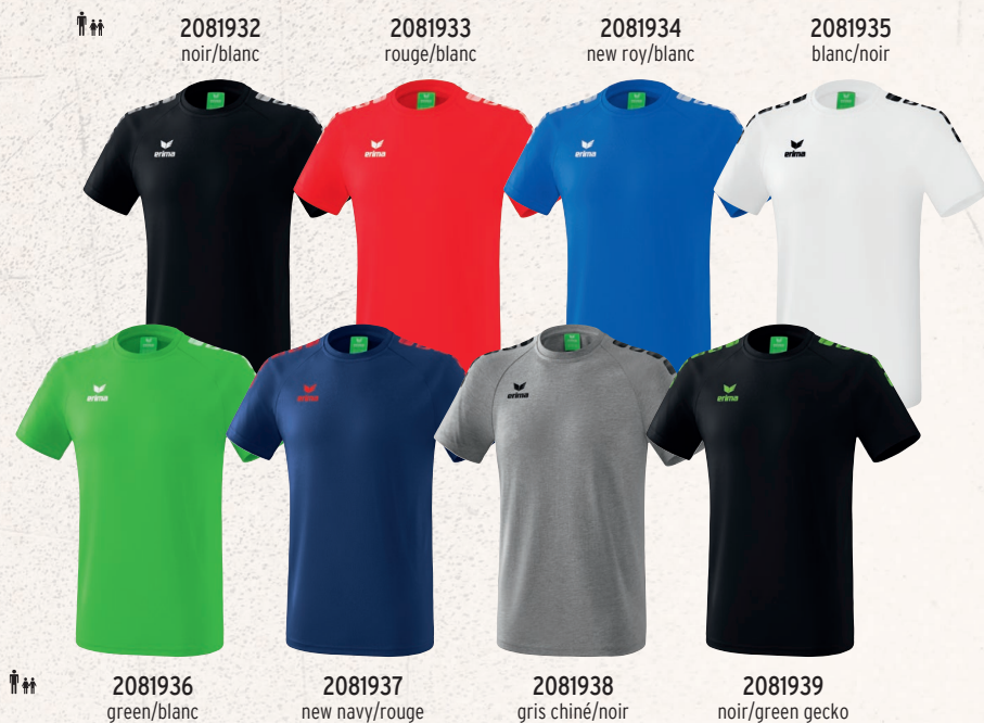
2081932 noir/blanc 2081933 rouge/blanc 2081934 new roy/blanc 2081935 blanc/noir 2081936 green/blanc 2081937 new navy/rouge 2081938 gris chiné/noir 2081939 noir/green gecko