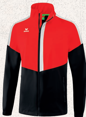
1052001 rouge/ noir/blanc

Enfants: T. 128-164 CHF 70,-* Adultes: T. S-XXXL CHF 75,-*