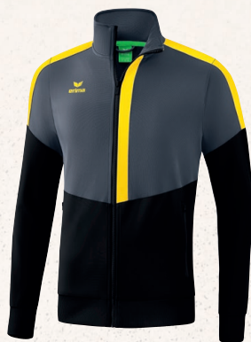
VESTE WORKER 👤 CHF 70,-*