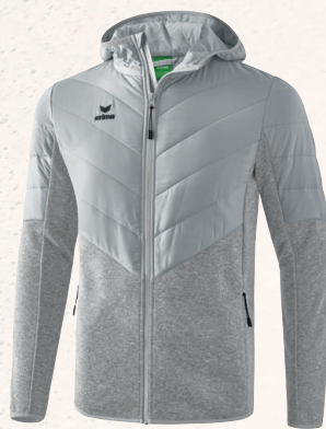
2061906 2061910 bleu clair