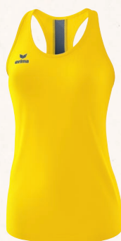
DÉBARDEUR 👤 CHF 55,-*