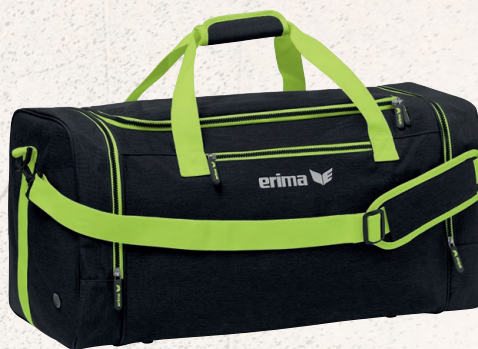
7232116 noir melange/lime