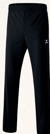
8100702 8100701 noir