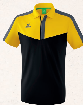
POLO 👤 CHF 60,-*