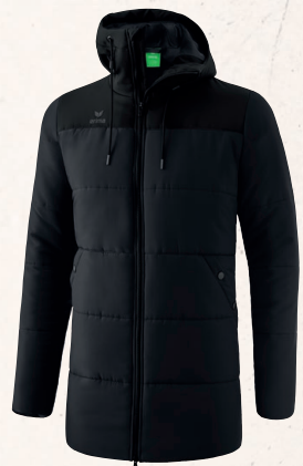
VESTE D'HIVER 👤 CHF 170,-*