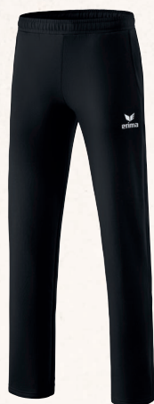
♂♂ 2101907 noir/blanc