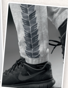
PANTALON SWEAT TEAM