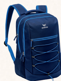
7232126 new navy/new roy