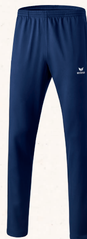
1100719 1100717 new navy/blanc