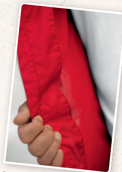
DOUBLURE EN MESH OUVERTE POUR UN MARQUAGE OPTIMAL