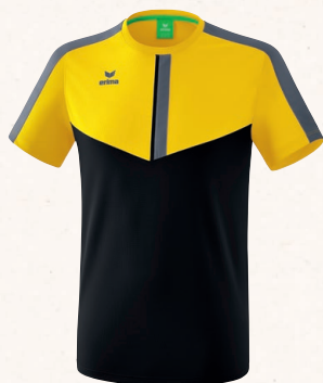
T-SHIRT 👤 CHF 55,-*