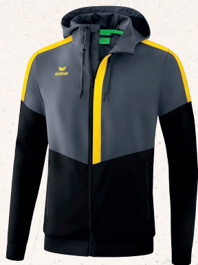
VESTE À CAPUCHE TRACKTOP 👤 CHF 95,-*