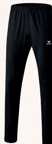
1100702 1100701 noir/blanc