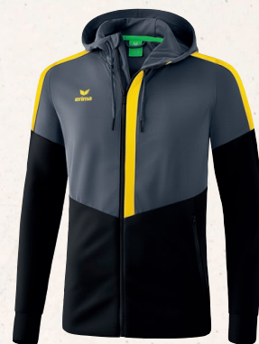
VESTE D'ENTRAÎNEMENT À CAPUCHE 👤 CHF 90,-*