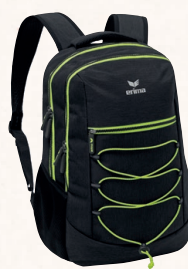
7232124 noir melange/lime