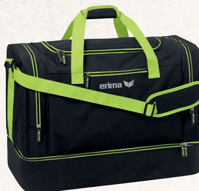
7232120 noir melange/lime