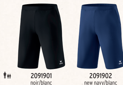
2091901 noir/blanc 2091902 new navy/blanc