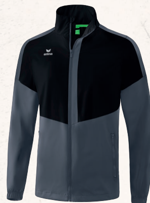
1052003 noir/ slate grey