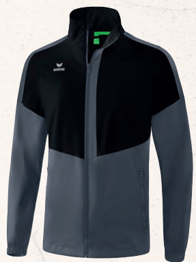
VESTE TOUS-TEMPS 👤 CHF 75,-*