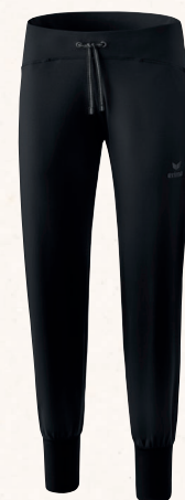
♀ 2101801 noir