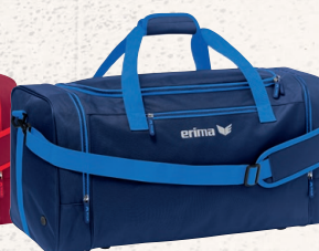
7232118 new navy/new roy