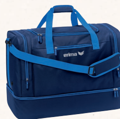
7232122 new navy/new roy