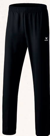
1100712 1100703 1100713 1100714 1100704 1100715 noir noir noir court longue

PANTALON AUSSI DANS LE COUPE FEMME DISPONIBLE