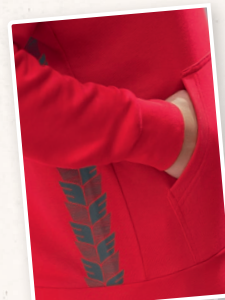
SWEAT À CAPUCHE