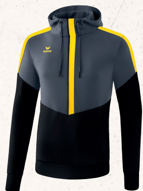
SWEAT À CAPUCHE 👤 CHF 85,-*