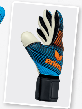
7221808 curacao/neon orange/schwarz