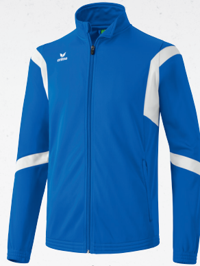
107675 new royal/weiß