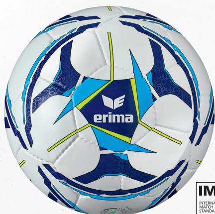
Gr. 5 7191805 curacao/new navy