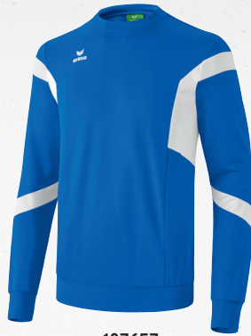
107657 new royal/weiß