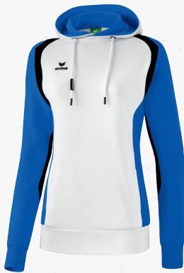
107636 weiß/new royal/schwarz