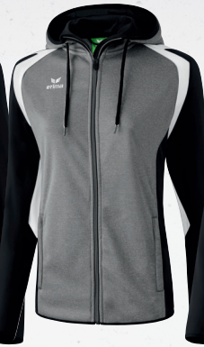
107683 grau melange/schwarz/weiß