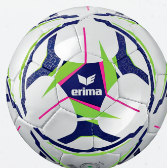
Gr. 4 7191809 new navy/green gecko