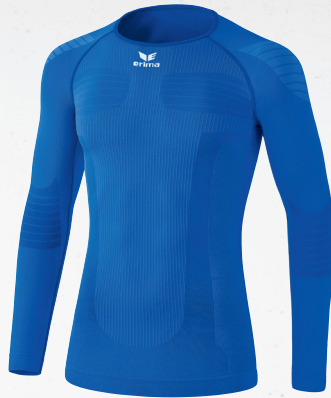
2250717 new royal