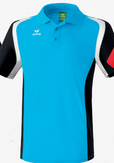
111614 curacao/ schwarz/weiß