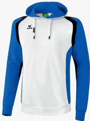
107616 weiß/new royal/schwarz