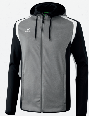
107655 grau melange/schwarz/weiß