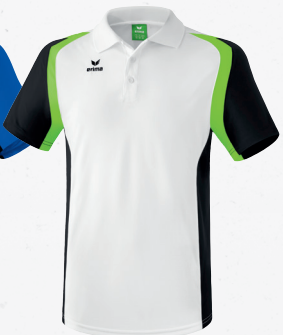
111617 weiß/schwarz/ green gecko