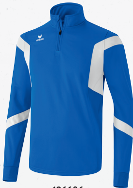
126606 new royal/weiß