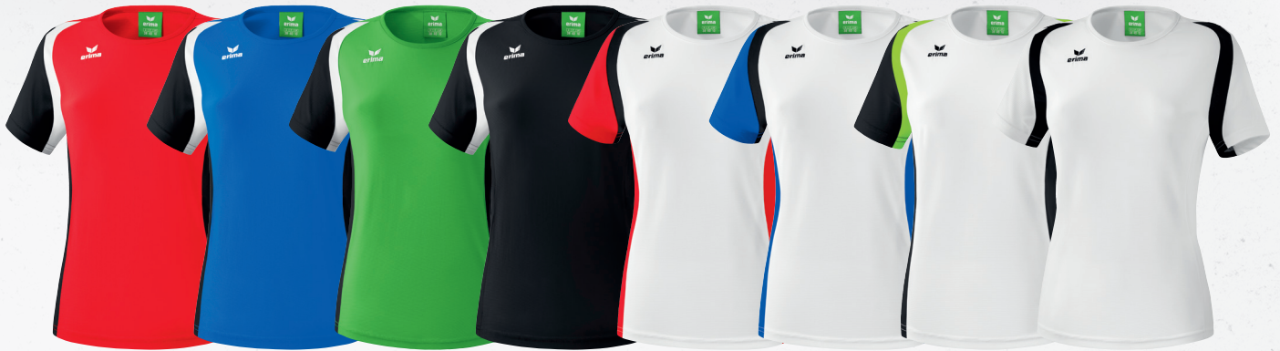
108610 rot/ schwarz/weiß