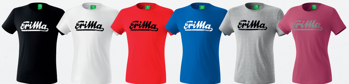
5080793 schwarz/weiß 5080794 weiß/schwarz 5080795 rot/schwarz 5080796 king blue/weiß 5080797 grau melange/schwarz 2080732 dahlia/grau