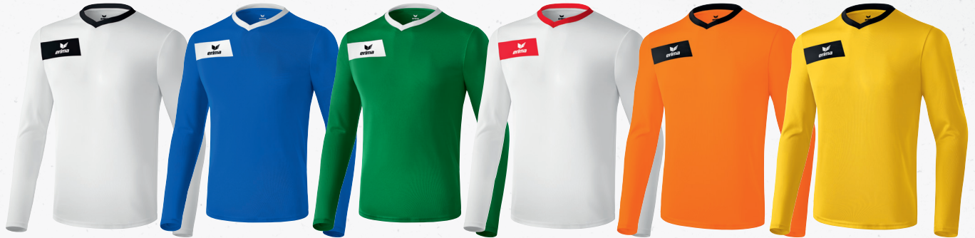
314531 weiß/schwarz 314532 new royal/weiß 314533 smaragd/weiß 314535 weiß/rot 314536 orange/schwarz 314537 gelb/schwarz