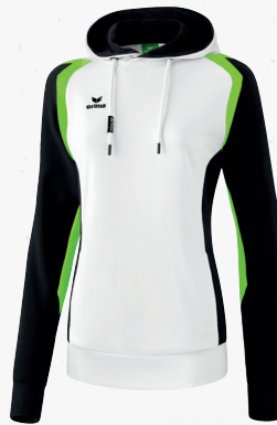
107637 weiß/schwarz/green gecko