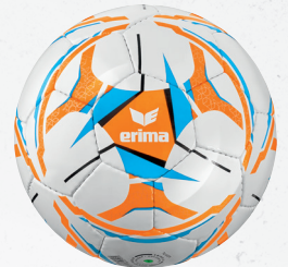
Gr. 3 7191817 neon orange/curacao