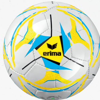
Gr. 4 7191811 gelb/blau