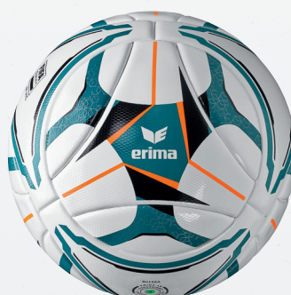
Gr. 4 7191804 petrol/orange