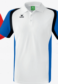
111616 weiß/new royal/ schwarz