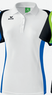
111636 weiß/ new royal/schwarz