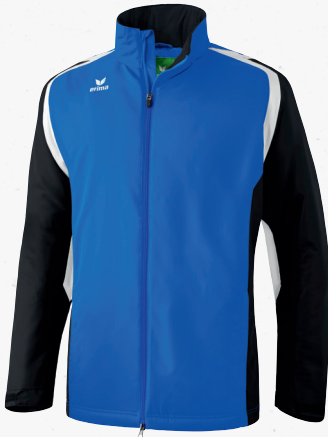
106605 new royal/schwarz/weiß