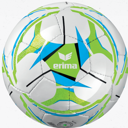
Gr. 5 7191810 curacao/green gecko