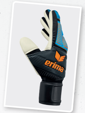
7221811 curacao/neon orange/schwarz