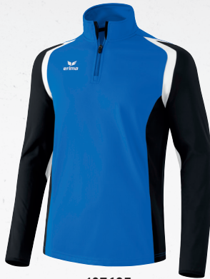
107685 new royal/schwarz/weiß