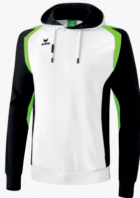
107617 weiß/schwarz/green gecko