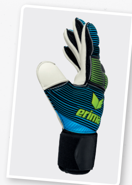
7221806 curacao/green gecko