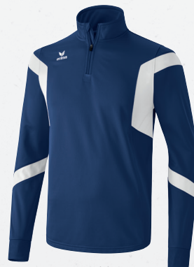
126612 new navy/weiß