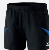
109614 schwarz/new royal