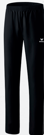
1100705 1100706 schwarz/weiß