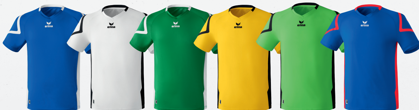
313541 new royal/weiß