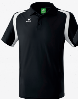
111613 schwarz/ weiß