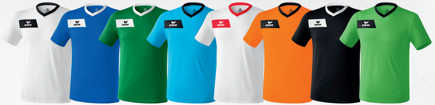
313531 weiß/schwarz 313532 new royal/weiß 313533 smaragd/weiß 313534 curacao/schwarz 313535 weiß/rot 313536 orange/schwarz 313538 schwarz/weiß 313539 green/schwarz