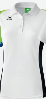
111637 weiß/schwarz/ green gecko