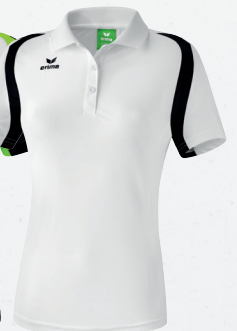
111638 weiß/ schwarz