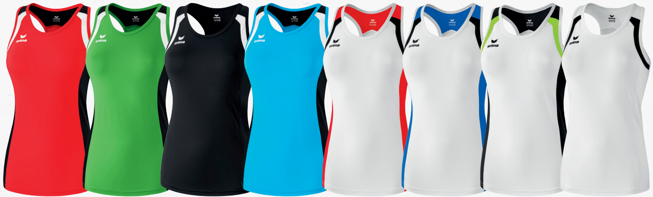
108619 rot/ schwarz/weiß