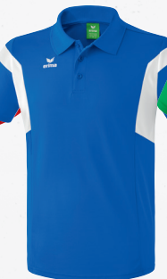
111641 new royal/weiß