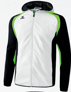
101617 weiß/schwarz/green gecko