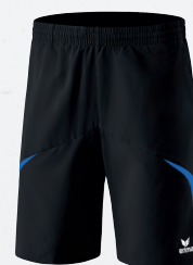
109607 schwarz/new royal