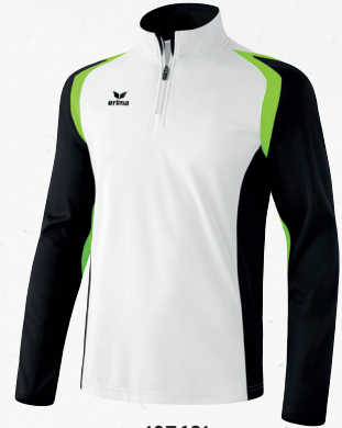
107691 weiß/schwarz/green gecko