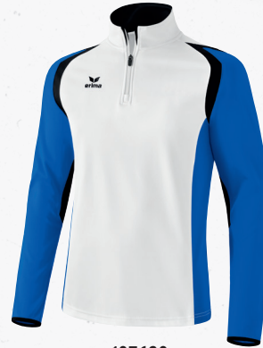
107690 weiß/new royal/schwarz