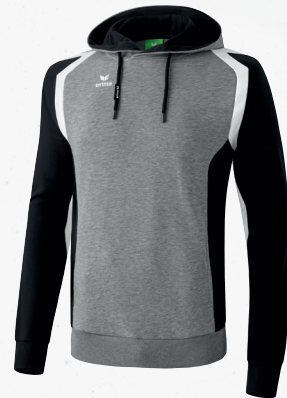
107618 grau melange/schwarz/weiß