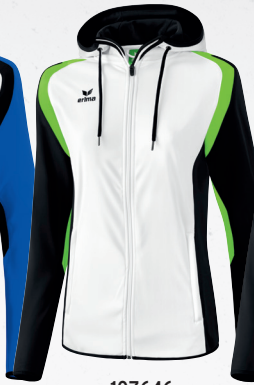
107646 weiß/schwarz/green gecko