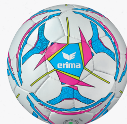
Gr. 3 7191807 pink/curacao