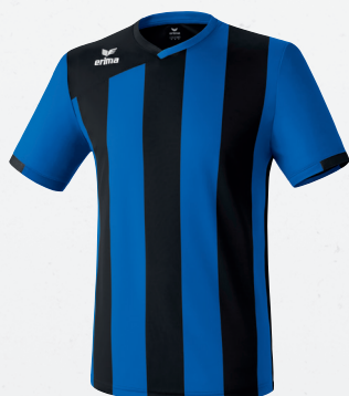
313422 new royal/schwarz