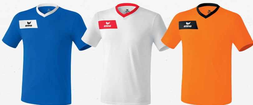
313532 new royal/weiß