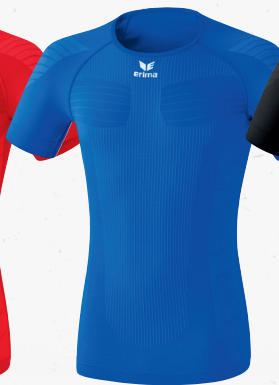
2250721 new royal