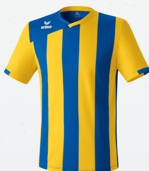
313425 gelb/new royal