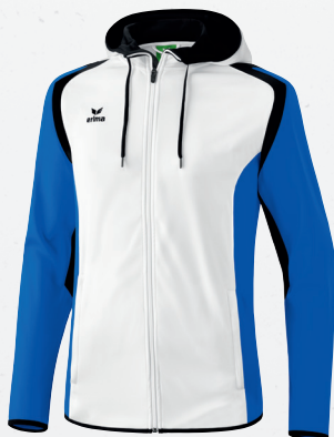
107653 weiß/new royal/schwarz