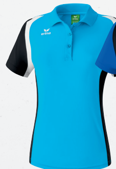
111634 curacao/ schwarz/weiß