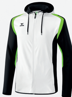
107654 weiß/schwarz/green gecko