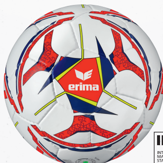
Gr. 4 7191806 new navy/orange