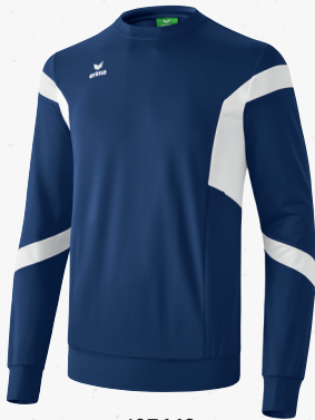
107663 new navy/weiß