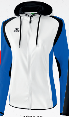
107645 weiß/new royal/schwarz