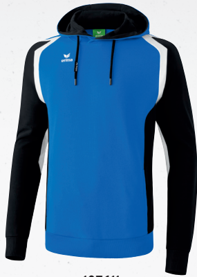
107611 new royal/schwarz/weiß