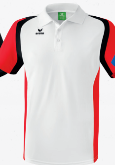
111615 weiß/ rot/schwarz