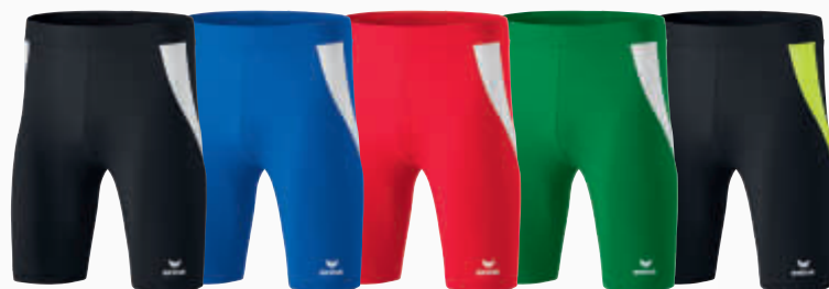
829400 noir/blanc 829401 new roy/blanc 829402 rouge/blanc 829511 émeraude/blanc 8291807 noir/jaune fluo