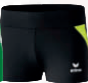
8291806 noir/jaune fluo