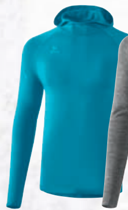
Hommes: 2331901 Femmes: 2331904 oriental blue