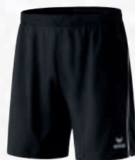
Hommes: 809600 noir