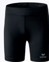
Femmes: 8290708 noir