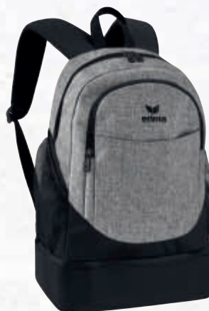
7232003 noir/gris chiné