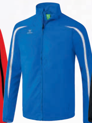
8060705 8060702 new roy/blanc