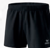
Femmes: 809601 noir