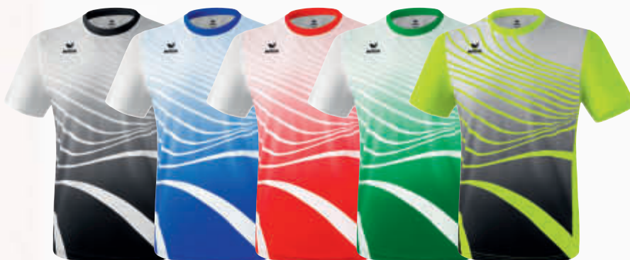
8081806 noir/blanc 8081807 new roy/blanc 8081808 rouge/blanc 8081809 émeraude/blanc 8081810 jaune fluo/noir