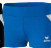
829409 new roy/blanc