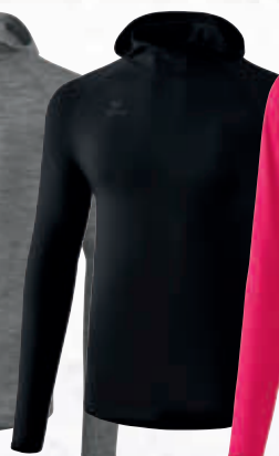
2331903 2331906 noir