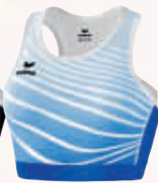
8281802 new roy/blanc