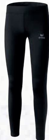
Femmes: 8290706 noir