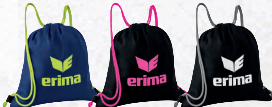
7231903 new navy/lime