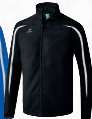
8060706 8060703 noir/blanc