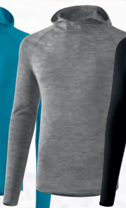
2331902 2331905 gris chiné