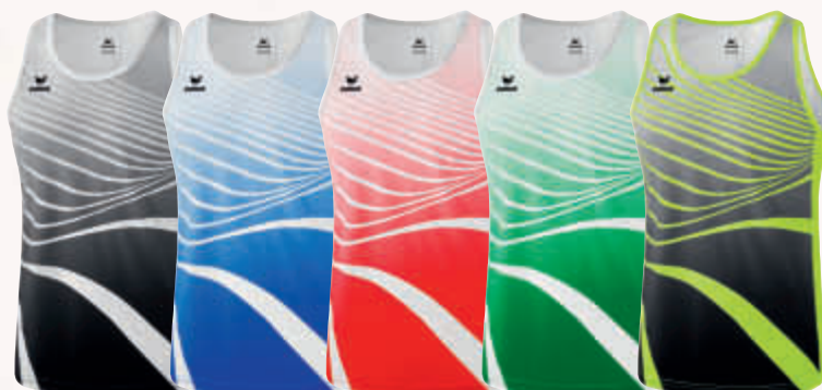
8081801 noir/blanc 8081802 new roy/blanc 8081803 rouge/blanc 8081804 émeraude/blanc 8081805 jaune fluo/noir