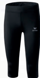
Femmes: 8290707 noir