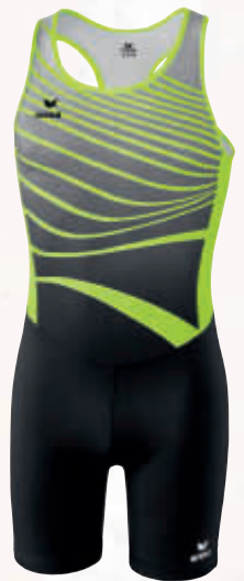
8291805 jaune fluo/noir