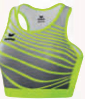
8281805 jaune fluo/noir