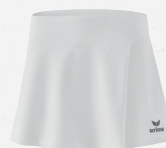
2412302 new white