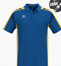
1112601 new roy/jaune