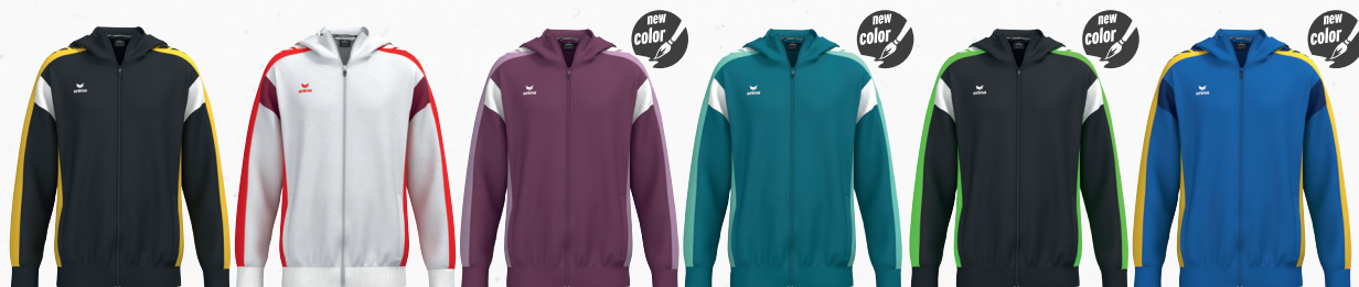
1032582 1032590 noir/jaune 1032583 1032585 blanc/rouge 1032630 1032619 burgund/lavender 1032631 1032620 tahitian blue/mint 1032632 1032621 noir/green gecko 1032644 1032640 new roy/jaune