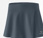
2412303 slate grey