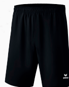
2152102 809210 noir