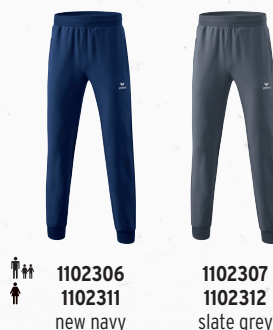
♂♂ 1102306 1102311 new navy ♂ 1102307 1102312 slate grey

» Pantalon noir disponible en 3 longueurs différentes