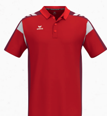
1112501 rouge/new bordeaux