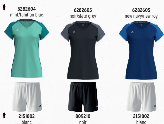
6282604 mint/tahitian blue 6282605 noir/slate grey 6282605 new navy/new roy 2151802 blanc 809210 noir 2151802 blanc