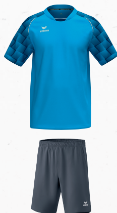
2152103 slate grey