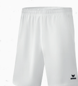
♂♂ 2152101 ♀ 2151802 blanc