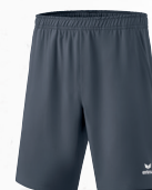
2152103 - slate grey