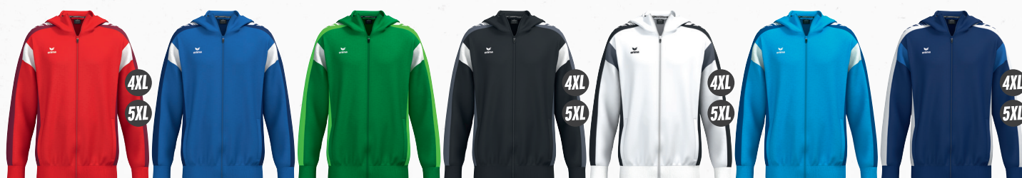
1032529 1032536 rouge/new bordeaux 1032530 1032537 new roy/new navy 1032531 1032538 émeraude/green gecko 1032532 1032539 noir/slate grey 1032533 1032540 blanc/noir 1032534 1032541 curaçao/new roy 1032535 1032542 new navy/blanc