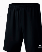
2152102 809210 noir