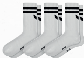
2182610 new white

T. 31-34, 35-38, 39-42, 43-46, 47-50 CHF 12,00*