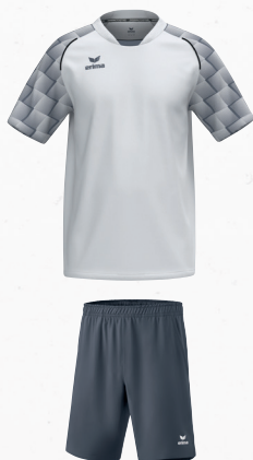
2152103 slate grey