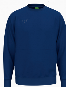
2072612 new navy