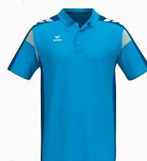
1112506 curaçao/new roy