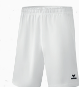
♂♂ 2152101 ♀ 2151802 blanc