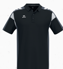
1112504 noir/slate grey