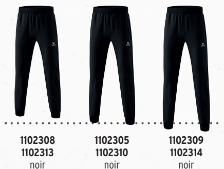
1102308 1102313 noir 1102305 1102310 noir 1102309 1102314 noir