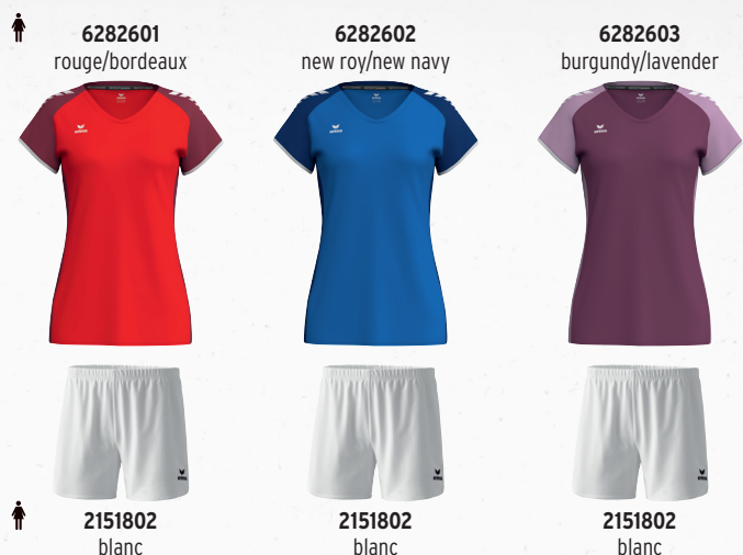
6282601 rouge/bordeaux 6282602 new roy/new navy 6282603 burgundy/lavender 2151802 blanc