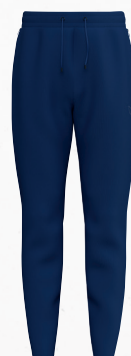
2102604 new navy