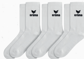
2182505 new white