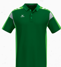
1112503 émeraude/green gecko