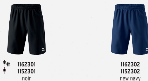
♂♂ 1162301 1152301 noir ♂ 1162302 1152302 new navy