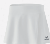
2412302 new white