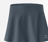
2412303 slate grey