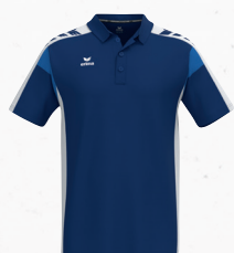
1112507 new navy/blanc