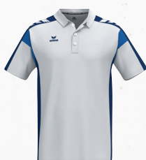
1112509 blanc/new navy