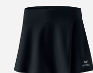
♂♂ 2412301 ♀ noir