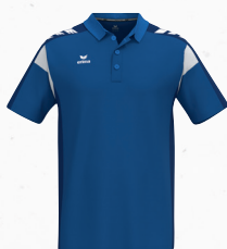
1112502 new roy/new navy