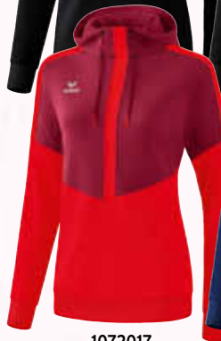
1072017 bordeaux/ rot