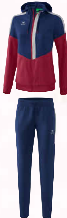
1102007 new navy/silver grey