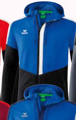
1032046 new royal/ schwarz/weiß