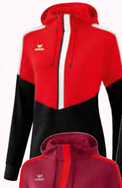
1072012 rot/ schwarz/weiß