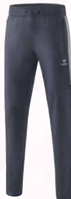
1102002 slate grey/silver grey