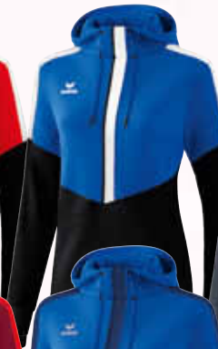
1072013 new royal/ schwarz/weiß