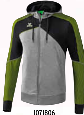
1071806 grau melange/schwarz/lime pop