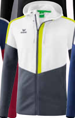
1032054 weiß/ slate grey/bio lime