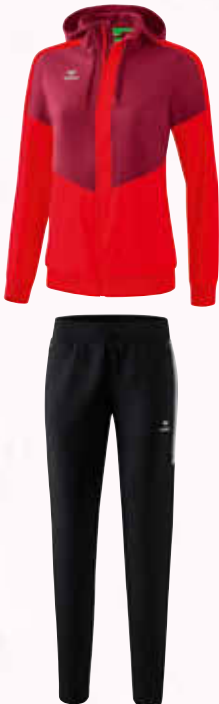
1102005 schwarz/silver grey