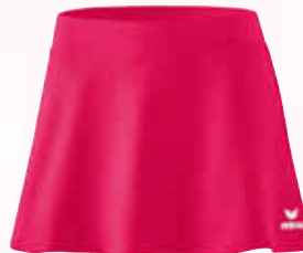
2411901 love rose

Material: 100% Polyester Innenslip: 88% Polyester, 12% Elasthan