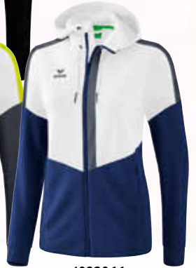
1032066 weiß/ new navy/slate grey