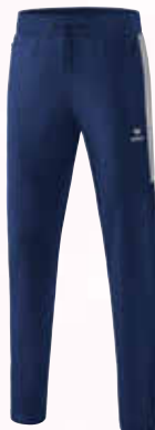
1102003 new navy/silver grey