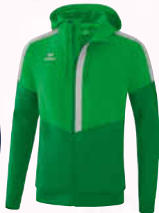
1032008 fern green/ smaragd/silver grey