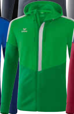
1032052 fern green/ smaragd/silver grey