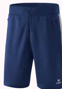
1152003 1152007 new navy/silver grey