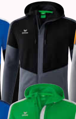
1032047 schwarz/ slate grey