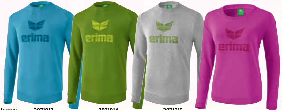
Herren: 2071813 2071814 2071815 - Damen: 2071830 2071831 2071832 2071833 niagara/ink blue twist of lime/lime pop hellgrau melange/twist of lime fuchsia/purple potion