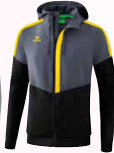
1032005 slate grey/ schwarz/gelb