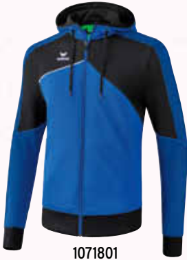
1071801 new royal/schwarz/weiß