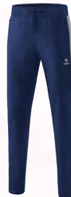
1102003 new navy/silver grey