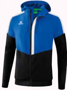
1032002 new royal/ schwarz/weiß