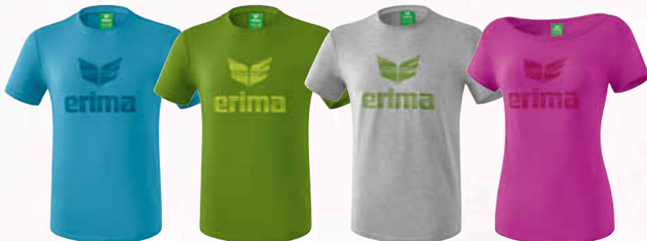
Herren: 2081801 2081802 2081803 - Damen: 2081807 2081808 2081809 2081810 niagara/ink blue twist of lime/lime pop hellgrau melange/twist of lime fuchsia/purple potion