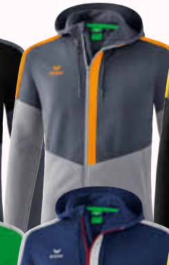
1032048 slate grey/ monument grey/new orange