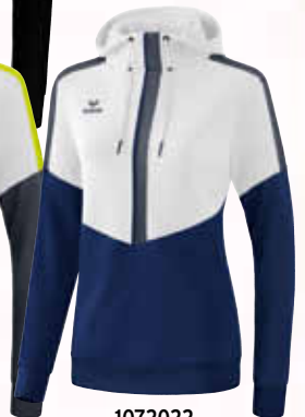
1072022 weiß/ new navy/slate grey