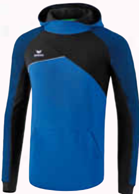
1071809 new royal/schwarz/weiß