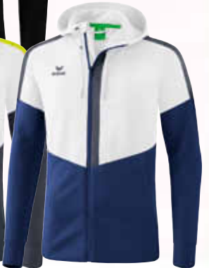
1032055 weiß/ new navy/slate grey