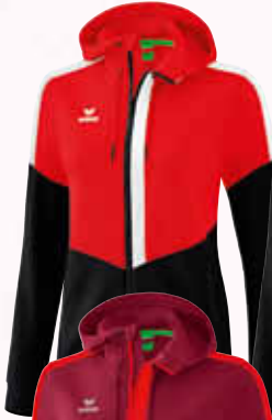
1032056 rot/ schwarz/weiß