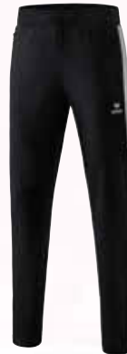
1102001 schwarz/silver grey