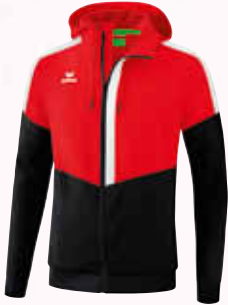
1032001 rot/ schwarz/weiß