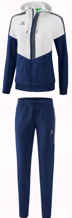
1102007 new navy/silver grey