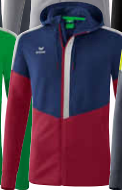
1032053 new navy/ bordeaux/silver grey