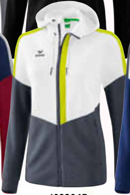
1032065 weiß/ slate grey/bio lime