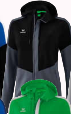
1032058 schwarz/ slate grey