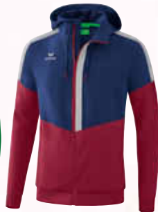
1032009 new navy/ bordeaux/silver grey