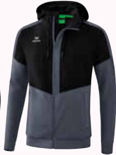
1032003 schwarz/ slate grey