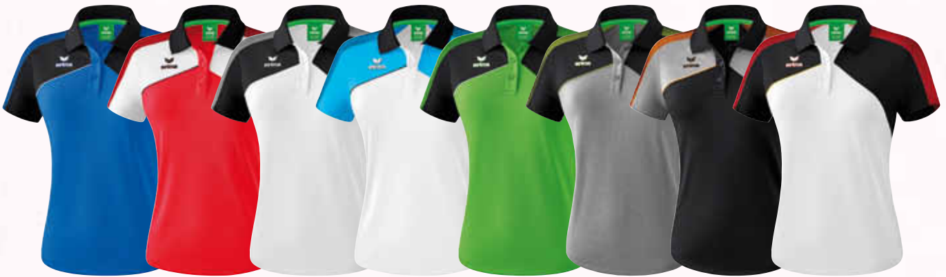
1111809 new royal/ schwarz/ weiß