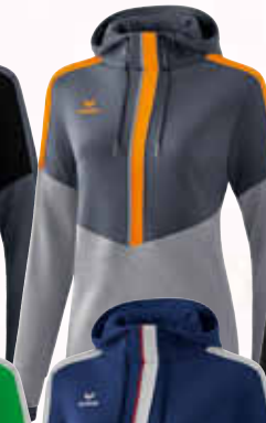
1072015 slate grey/ monument grey/new orange