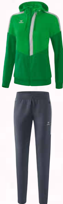
1102006 slate grey/silver grey