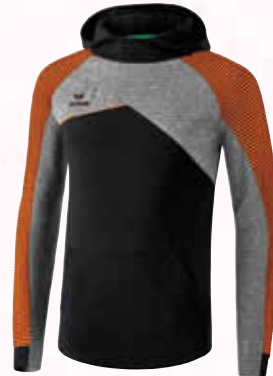
1071815 schwarz/grau melange/neon orange