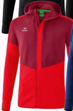
1032050 bordeaux/ rot