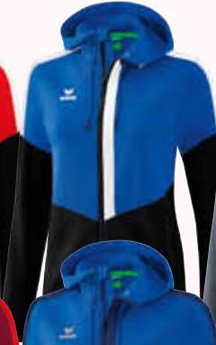
1032057 new royal/ schwarz/weiß