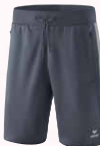
1152002 1152006 slate grey/silver grey