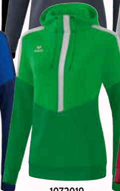
1072019 fern green/ smaragd/silver grey