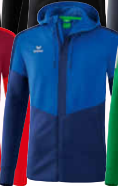
1032051 new royal/ new navy