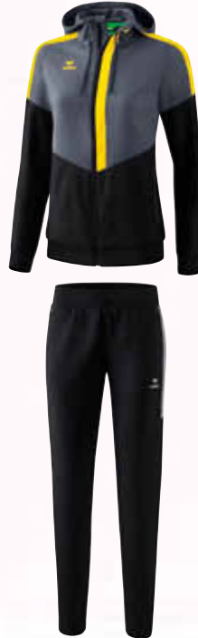
1102005 schwarz/silver grey