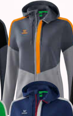
1032059 slate grey/ monument grey/new orange