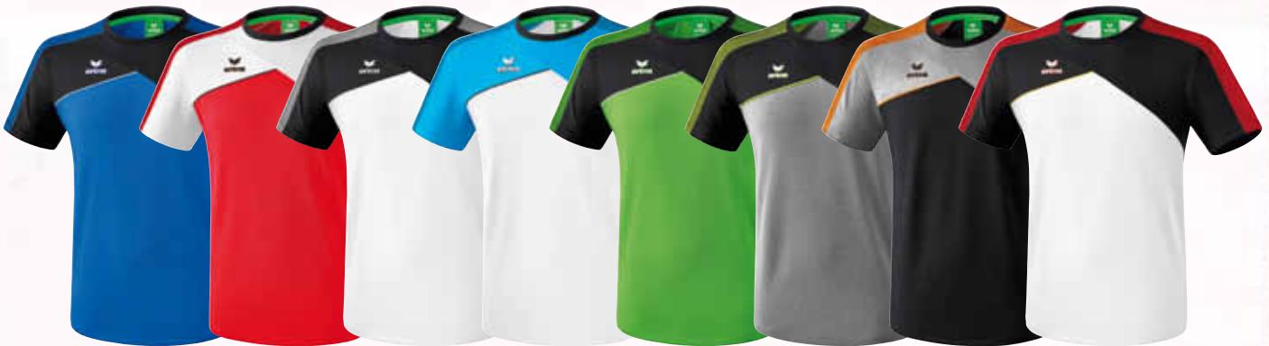
1081801 new royal/ schwarz/ weiß