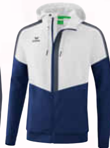
1032011 weiß/ new navy/slate grey