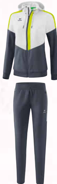
1102006 slate grey/silver grey