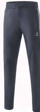
1102002 slate grey/silver grey