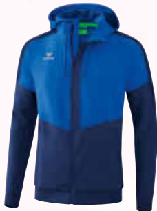
1032007 new royal/ new navy