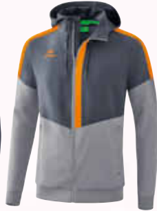
1032004 slate grey/ monument grey/new orange