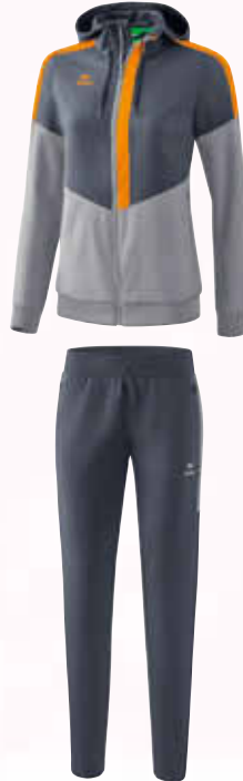
1102006 slate grey/silver grey