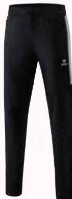
1102001 schwarz/silver grey