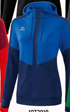
1072018 new royal/ new navy