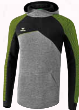
1071814 grau melange/schwarz/lime pop