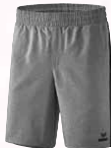
1161802 grau melange/schwarz