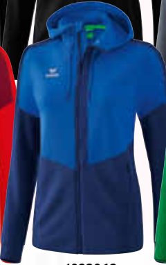
1032062 new royal/ new navy