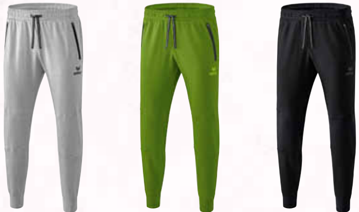
Kinder: Gr. 128-164 CHF 50,-* Erwachsene: Gr. S-XXXL CHF 60,-* Damen: Gr. 34-48 CHF 60,-*