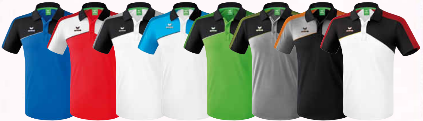
1111801 new royal/ schwarz/ weiß