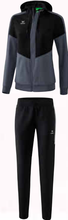
1102005 schwarz/silver grey