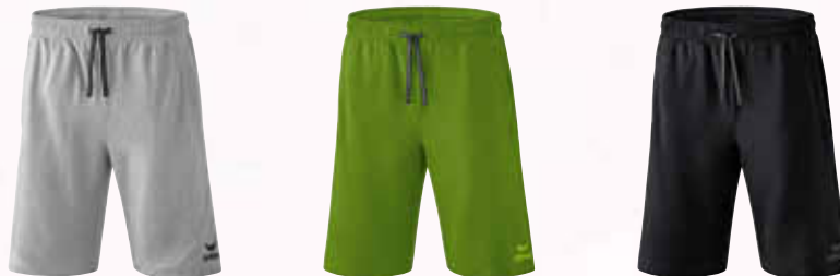
Herren: 2081804 2081805 2081806 Damen: 2321801 2321802 2321803 hellgrau melange/schwarz twist of lime/lime pop schwarz

Weitere Artikel der Basics Essential Linie im ERIMA Gesamtkatalog 2020