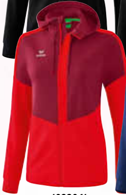
1032061 bordeaux/ rot