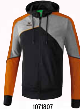
1071807 schwarz/grau melange/neon orange