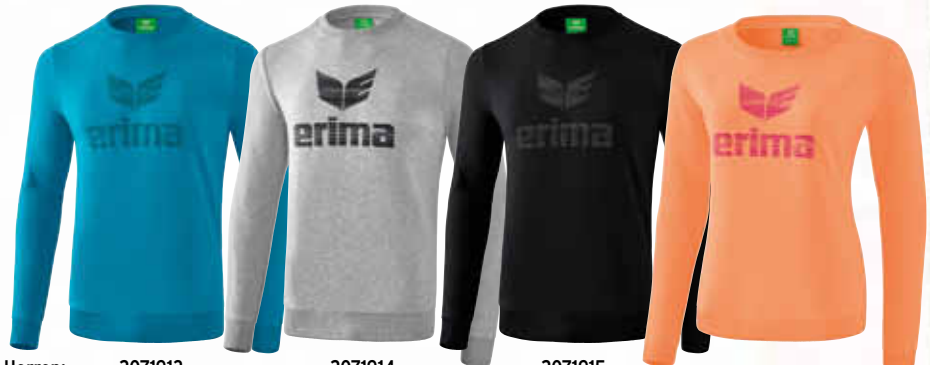
Kinder: Gr. 128-164 CHF 50,-* Erwachsene: Gr. S-XXXL CHF 55,-* Damen: Gr. 34-48 CHF 55,-*