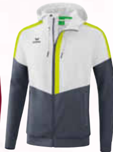
1032010 weiß/ slate grey/bio lime