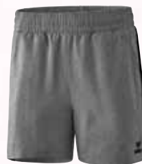
1151802 grau melange/schwarz