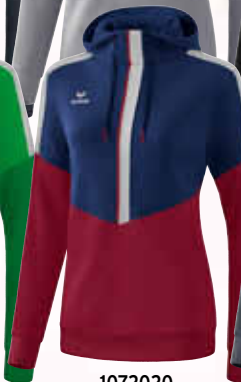
1072020 new navy/ bordeaux/silver grey