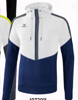
1072011 weiß/ new navy/slate grey