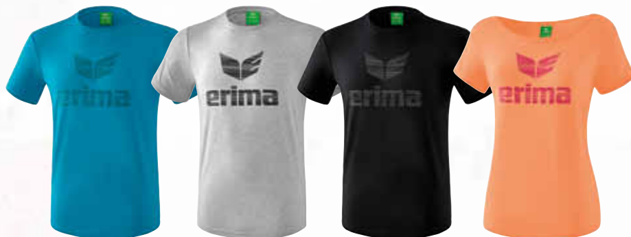
Herren: 2081940 2081941 2081942 - Damen: 2081943 2081944 2081945 2081946 oriental blue/colonial blue hellgrau melange/schwarz schwarz/grau peach/love rose