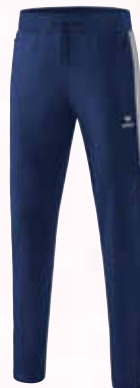
1102003 new navy/silver grey