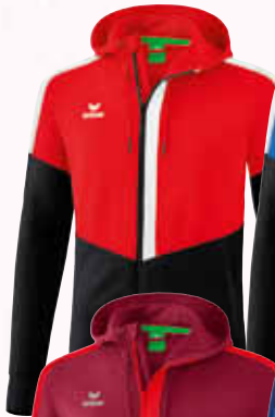
1032045 rot/ schwarz/weiß