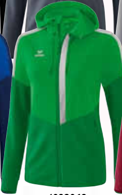
1032063 fern green/ smaragd/silver grey