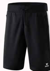
1152004 1152008 schwarz/weiß