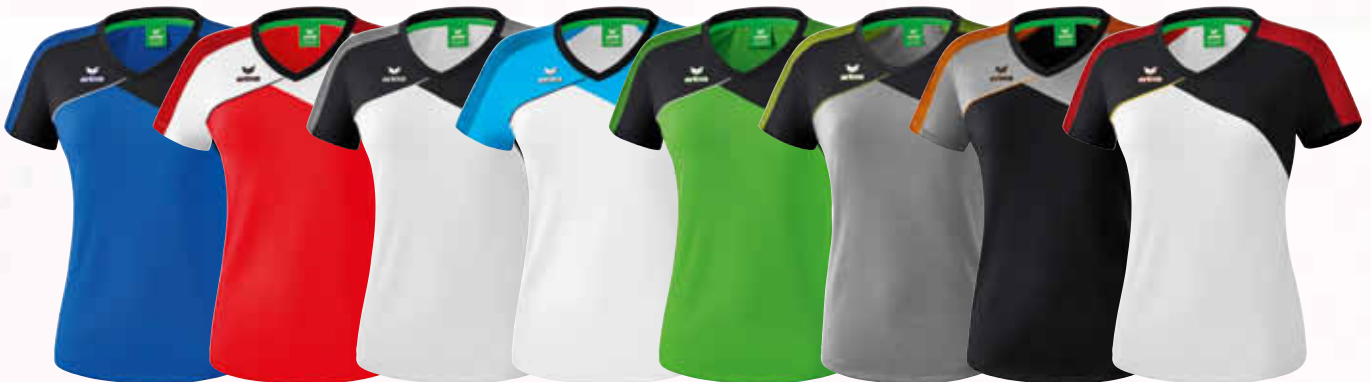
1081809 new royal/ schwarz/ weiß