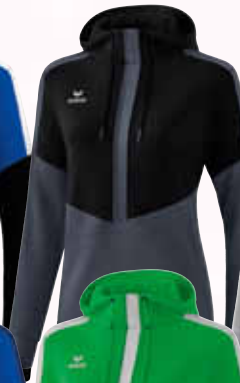
1072014 schwarz/ slate grey