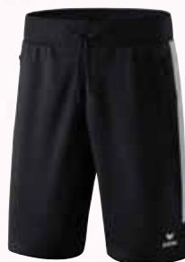
Herren: 1152001 Damen: 1152005 schwarz/silver grey