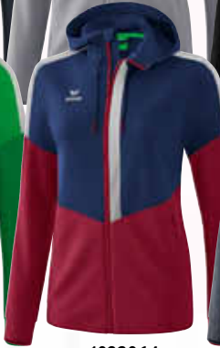
1032064 new navy/ bordeaux/silver grey