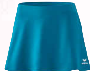
2411902 oriental blue

Kinder: Gr. 128-164 CHF 50,-* Damen: Gr. 34-44 CHF 55,-*