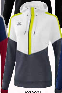
1072021 weiß/ slate grey/bio lime