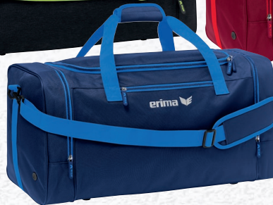
7232118 new navy/new roy