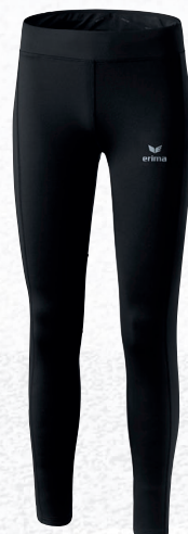
Femmes: 8290705 noir