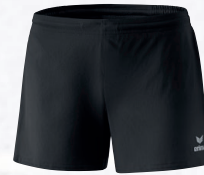
Femmes: 809821 noir