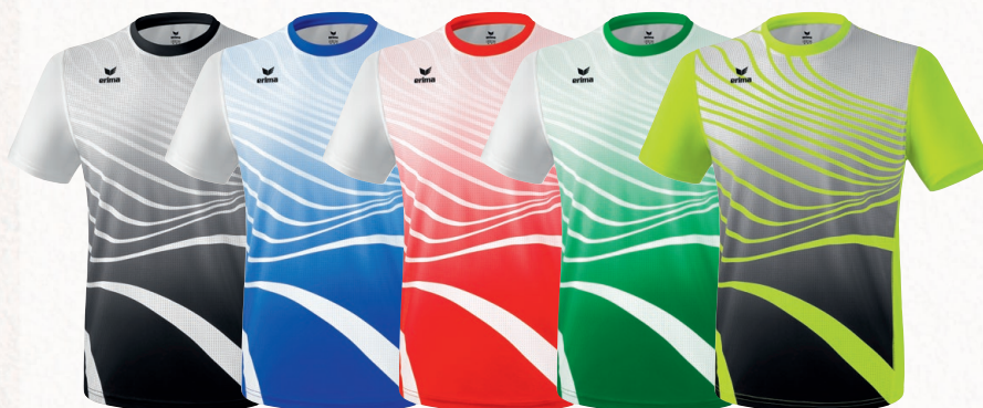
8081806 noir/blanc 8081807 new roy/blanc 8081808 rouge/blanc 8081809 émeraude/blanc 8081810 neon jaune/noir