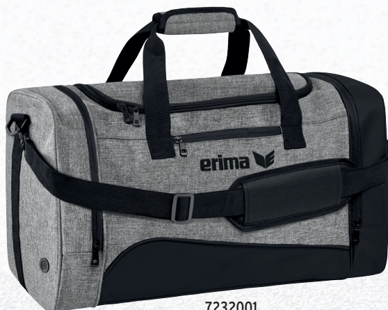
7232001 noir/gris chiné

7232001 T. S CHF 35,-* 7232001 T. M CHF 40,-* 7232001 T. L CHF 50,-*