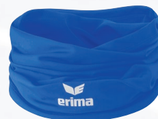
3242004 new roy