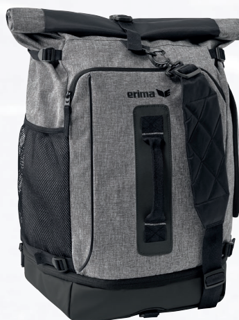
7231803 gris chiné