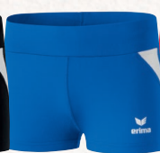
829409 new roy/blanc