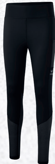
Femmes: 2292201 noir