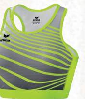
8281805 neon jaune/noir