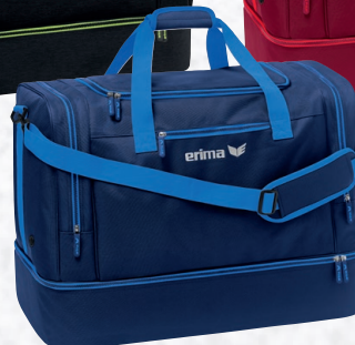
7232122 new navy/new roy