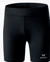
Femmes: 8290708 noir