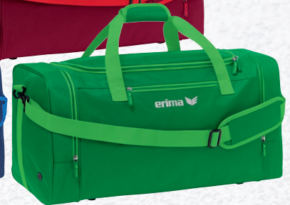
7232119 émeraude/fern green