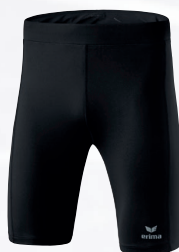
Hommes/enfants: 8290703 noir