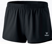
Hommes/enfants: 109611 noir