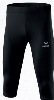
Hommes/enfants: 8290702 noir