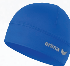
8122002 new roy