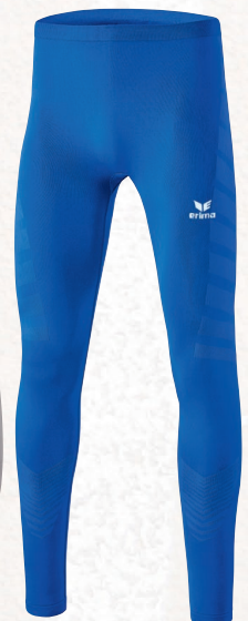
2290702 new roy