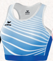
8281802 new roy/blanc