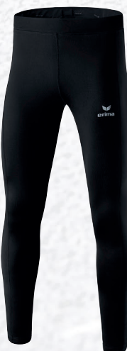
Hommes/enfants: 8290704 noir