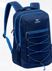
7232126 new navy/new roy