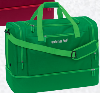
7232123 émeraude/fern green