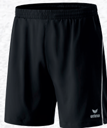
Hommes/enfants: 809600 noir