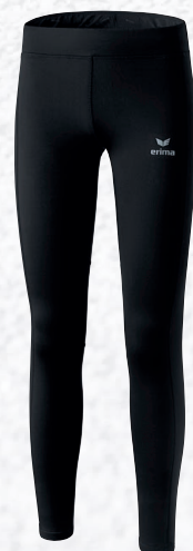
Femmes: 8290706 noir