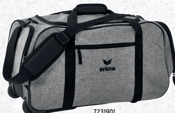
7231901 gris chiné/noir

7231901 T. S CHF 75,-* 7231901 T. M CHF 100,-*