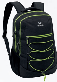
7232124 noir chiné/lime