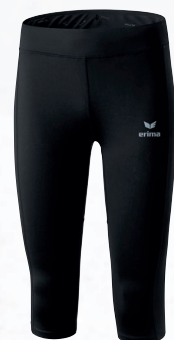
Femmes: 8290707 noir