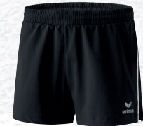
Femmes: 809601 noir