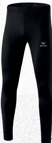
Hommes/enfants: 8290701 noir