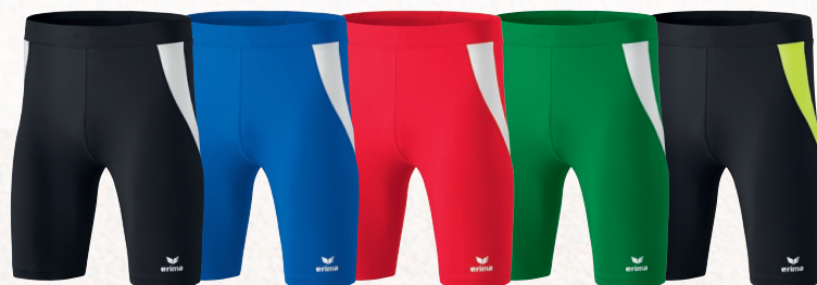
829400 noir/blanc 829401 new roy/blanc 829402 rouge/blanc 829511 émeraude/blanc 8291807 noir/neon jaune