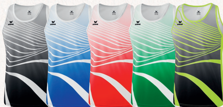
8081801 noir/blanc 8081802 new roy/blanc 8081803 rouge/blanc 8081804 émeraude/blanc 8081805 neon jaune/noir