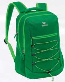
7232127 émeraude/fern green