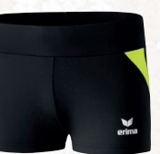
8291806 noir/neon jaune