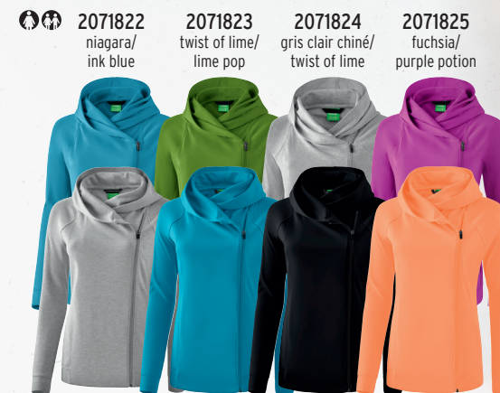
2071822 niagara/ink blue 2071823 twist of lime/lime pop 2071824 gris clair chiné/twist of lime 2071825 fuchsia/purple potion 2071917 gris clair chiné/noir 2071916 oriental blue/colonial blue 2071918 noir/gris 2071919 peach/love rose