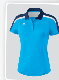
MODÈLE DE DAMES