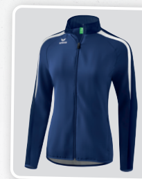
MODÈLE DE DAMES