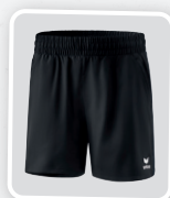
MODÈLE DE DAMES