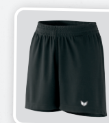
MODÈLE DE DAMES