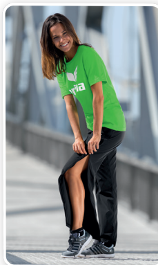
MODÈLE DE DAMES