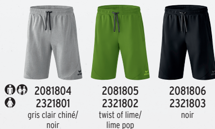
2081804 2321801 gris clair chiné/noir 2081805 2321802 twist of lime/lime pop 2081806 2321803 noir