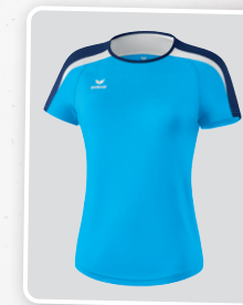
MODÈLE DE DAMES