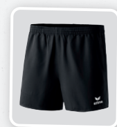
MODÈLE DE DAMES