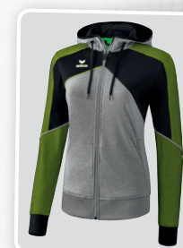
MODÈLE DE DAMES

1071808 1071832 blanc/ noir/ rouge/jaune