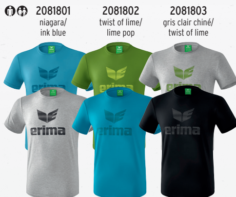
2081801 niagara/ink blue 2081802 twist of lime/lime pop 2081803 gris clair chiné/twist of lime 2081941 gris clair chiné/noir 2081940 oriental blue/colonial blue 2081942 noir/gris