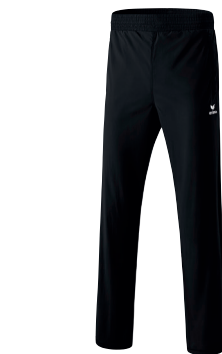
8100702 8100701 noir