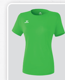
MODÈLE DE DAMES