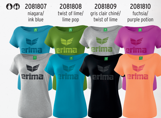
2081807 niagara/ink blue 2081808 twist of lime/lime pop 2081809 gris clair chiné/twist of lime 2081810 fuchsia/purple potion 2081944 gris clair chiné/noir 2081943 oriental blue/colonial blue 2081945 noir/gris 2081946 peach/love rose