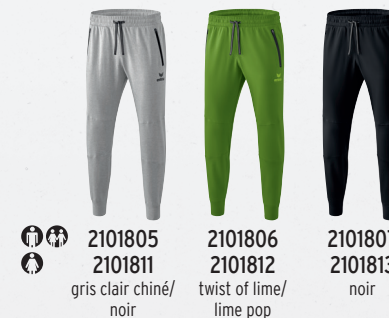
2101805 2101811 gris clair chiné/noir 2101806 2101812 twist of lime/lime pop 2101807 2101813 noir