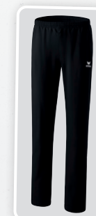
MODÈLE DE DAMES