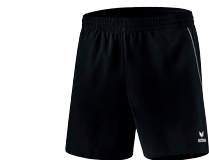
1090703 1320703 noir/blanc