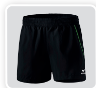
MODÈLE DE DAMES