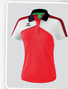
MODÈLE DE DAMES