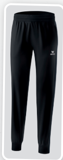
MODÈLE DE DAMES