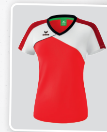
MODÈLE DE DAMES