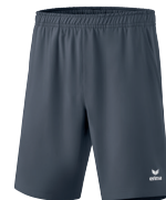
2152103 slate grey