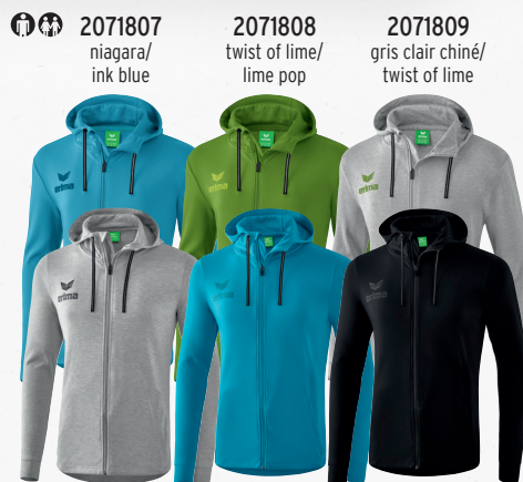
2071807 niagara/ink blue 2071808 twist of lime/lime pop 2071809 gris clair chiné/twist of lime 2071908 gris clair chiné/noir 2071907 oriental blue/colonial blue 2071909 noir/gris