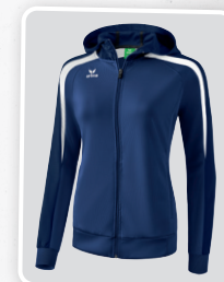
MODÈLE DE DAMES