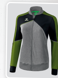
MODÈLE DE DAMES

1011808 1011816 blanc/ noir/ rouge/jaune