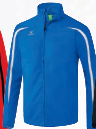
8060705 8060702 new royal/weiß