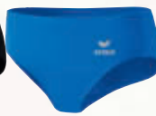
829407 new royal