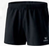
Damen: 809601 schwarz