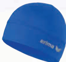
8122002 new royal