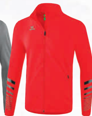
8061903 8061906 rot