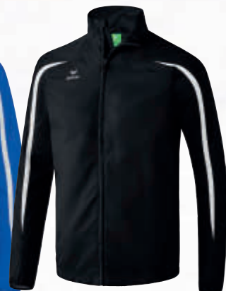
8060706 8060703 schwarz/weiß