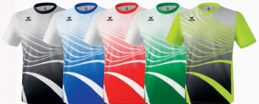
8081806 schwarz/weiß 8081807 new royal/weiß 8081808 rot/weiß 8081809 smaragd/weiß 8081810 neon gelb/schwarz