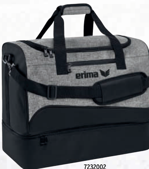
7232002 schwarz/grau melange