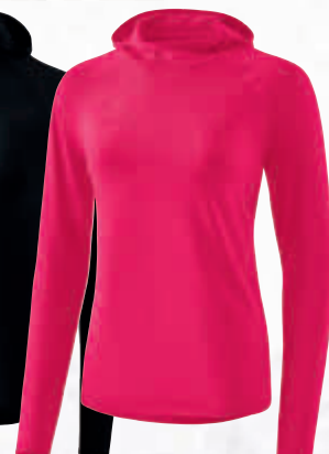
- 2331907 love rose