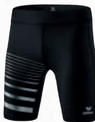
Herren: 8291903 Damen: 8291904 schwarz