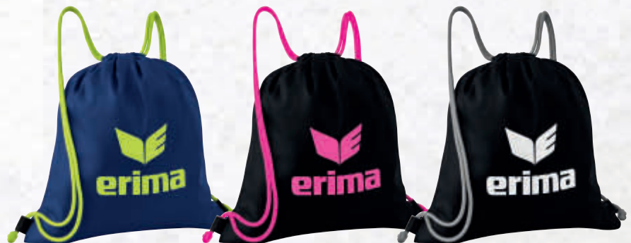
7231903 new navy/lime