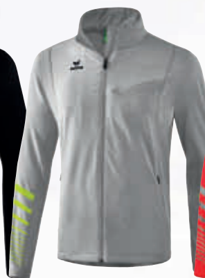
8061902 8061905 grau melange