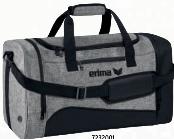
7232001 schwarz/grau melange