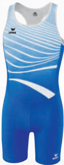
8291802 new royal/weiß