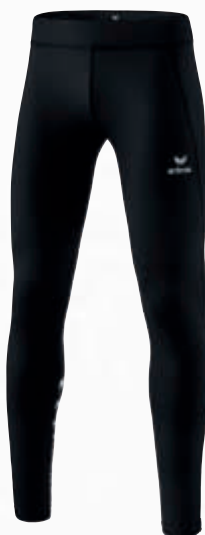
Herren: 8291901 Damen: 8291902 schwarz