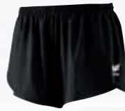
Herren: 109611 schwarz