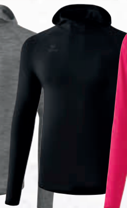
2331903 2331906 schwarz