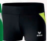
8291806 schwarz/neon gelb