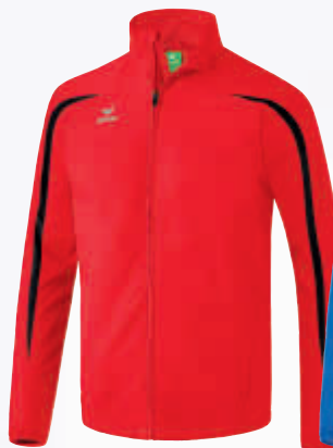
Herren: 8060704 Damen: 8060701 rot/schwarz