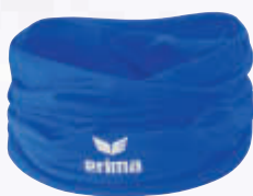
3242004 new royal