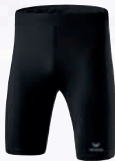
Herren: 8290703 schwarz