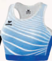
8281802 new royal/weiß