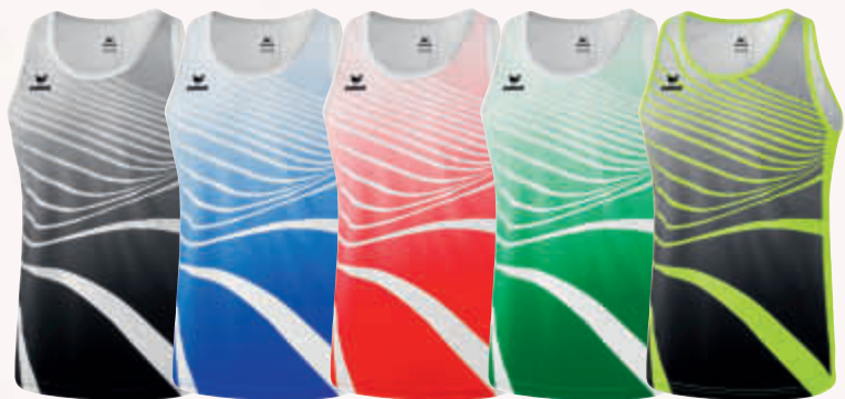
8081801 schwarz/weiß 8081802 new royal/weiß 8081803 rot/weiß 8081804 smaragd/weiß 8081805 neon gelb/schwarz