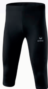
Herren: 8290702 schwarz