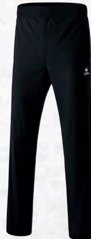
Damen: 8100701 schwarz