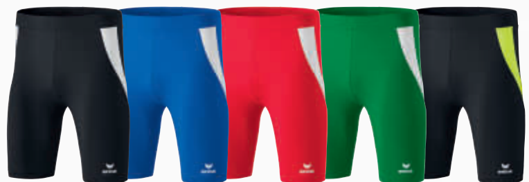
829400 schwarz/weiß 829401 new royal/weiß 829402 rot/weiß 829511 smaragd/weiß 8291807 schwarz/neon gelb