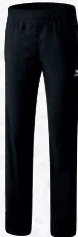
Herren: 8100702 schwarz