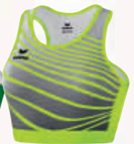
8281805 neon gelb/schwarz