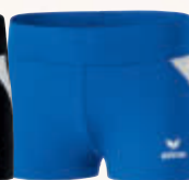
829409 new royal/weiß