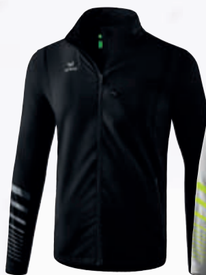
Herren: 8061901 Damen: 8061904 schwarz