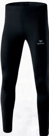
Herren: 8290704 schwarz