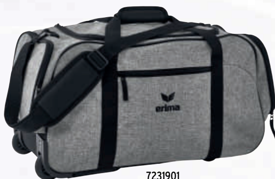
7231901 grau melange/schwarz