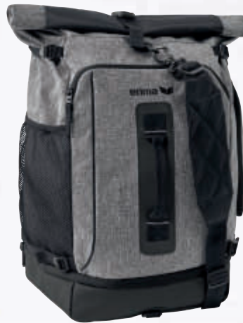
7231803 grau melange