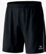
Herren: 809600 schwarz