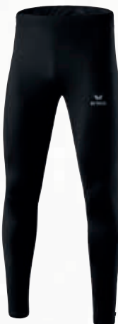
Herren: 8290701 schwarz