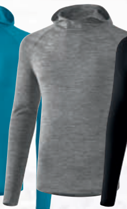
2331902 2331905 grau melange