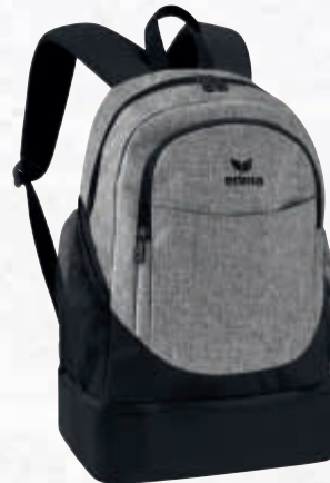
7232003 schwarz/grau melange