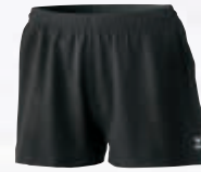
Damen: 809821 schwarz